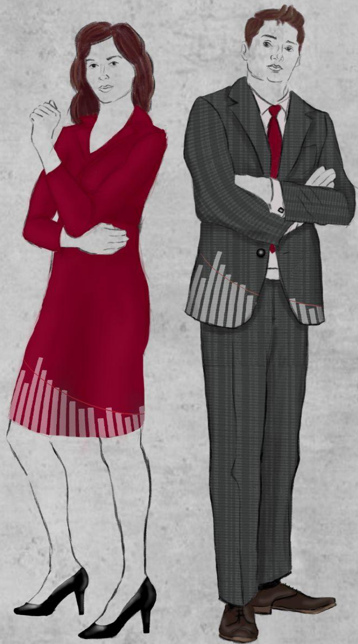
Księżniczka i Księżę